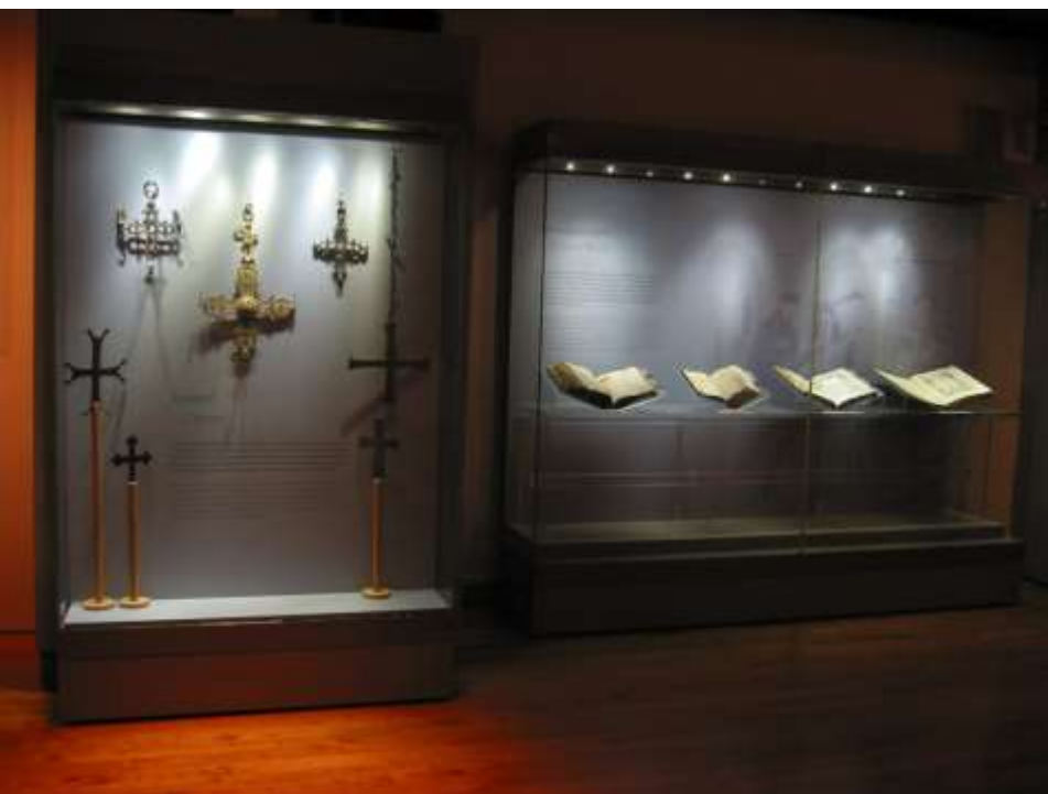
Προθήκες σταυρών, παλαιτύπων