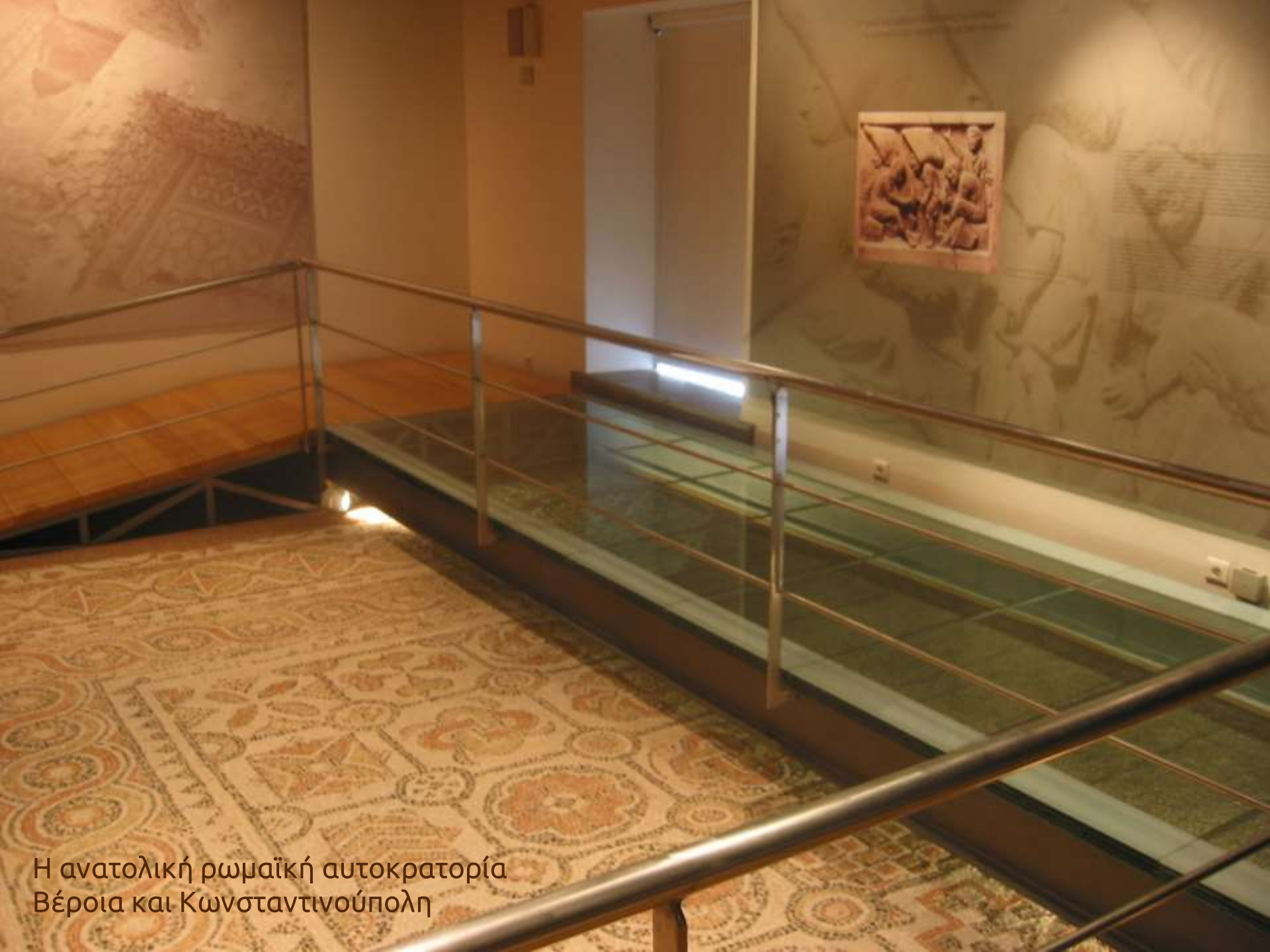
Η ανατολική ρωμαϊκή αυτοκρατορία Βέροια και Κωνσταντινούπολη