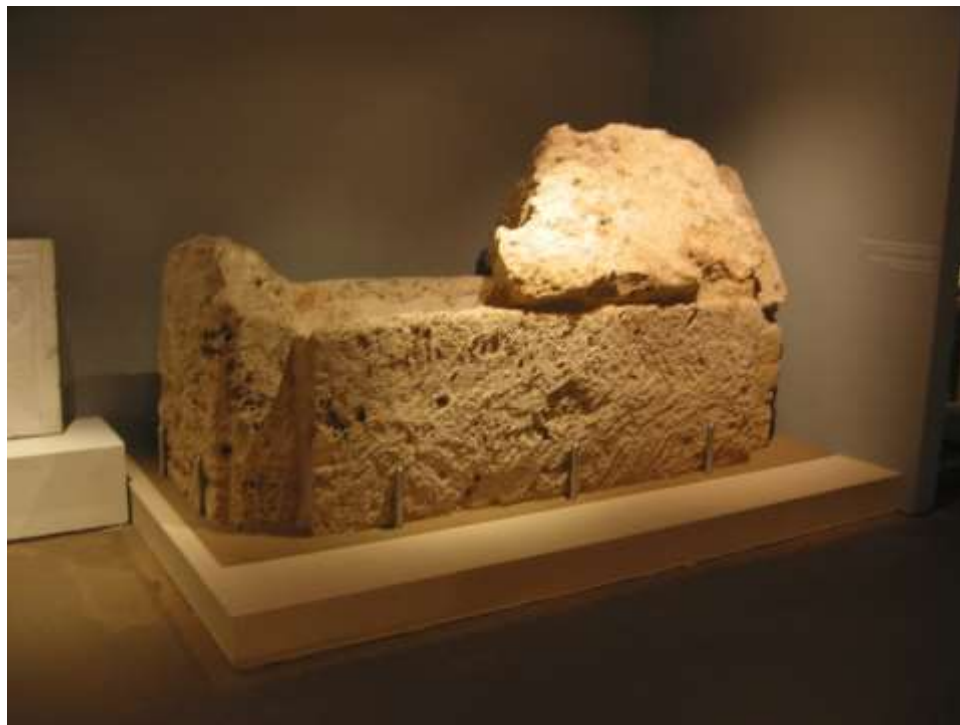
Η ταφή και τα έθιμα