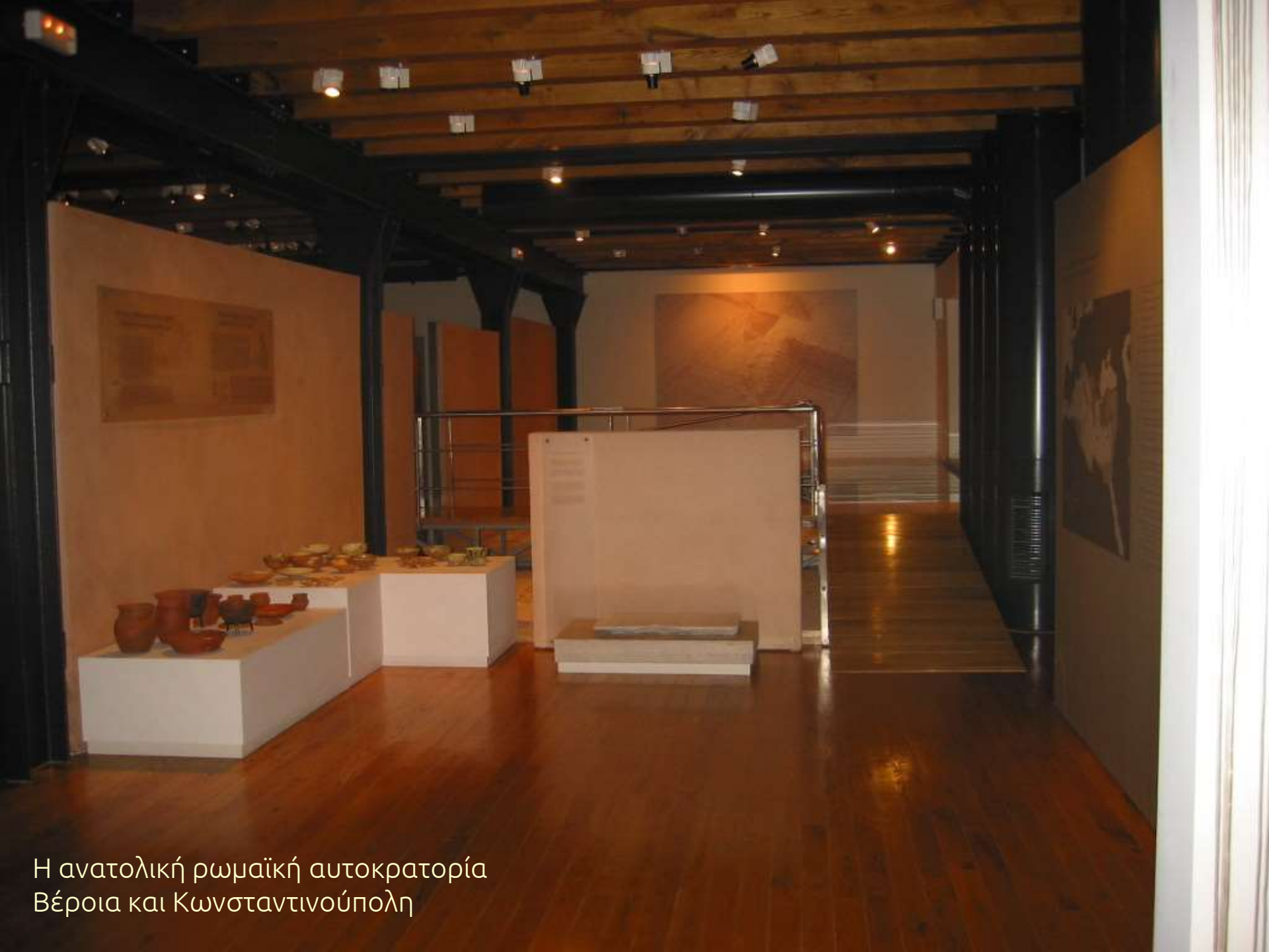
Η ανατολική ρωμαϊκή αυτοκρατορία Βέροια και Κωνσταντινούπολη