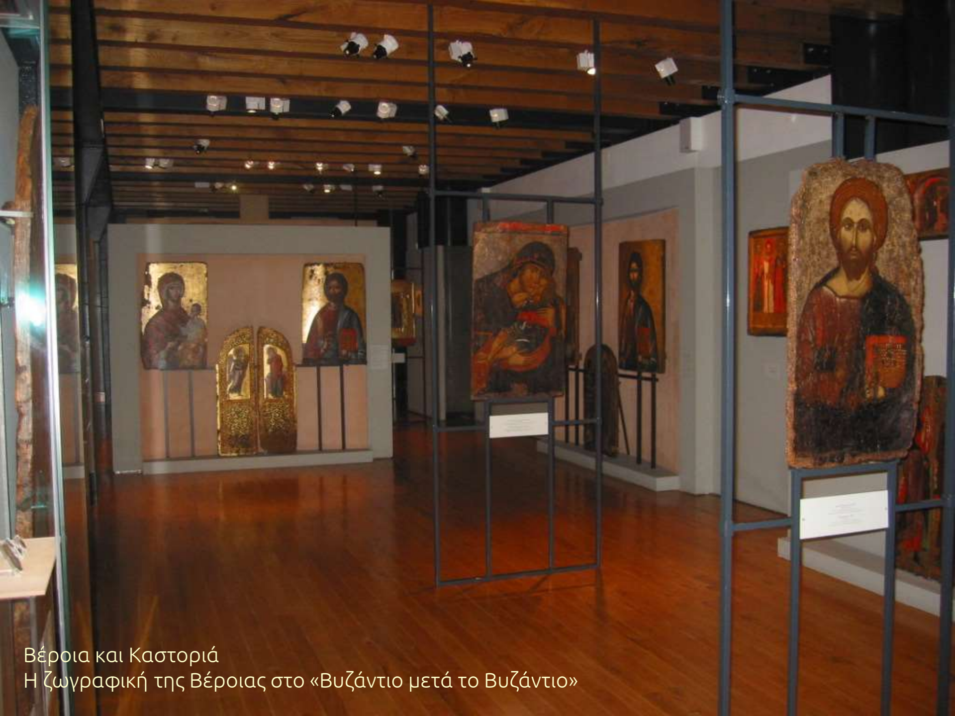
Βέροια και Καστοριά Η ζωγραφική της Βέροιας στο «Βυζάντιο μετά το Βυζάντιο»