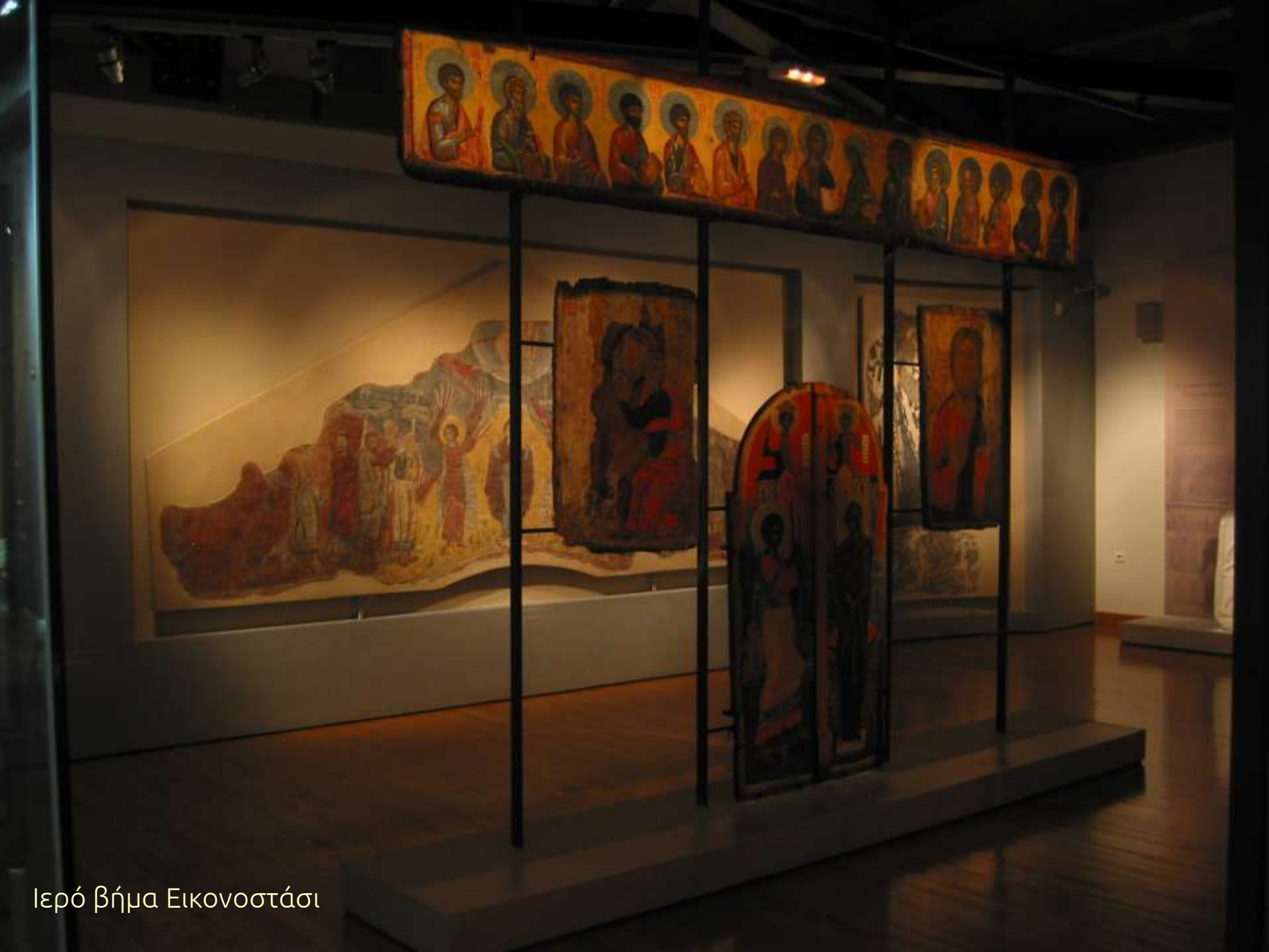
Ιερό βήμα Εικονοστάσι