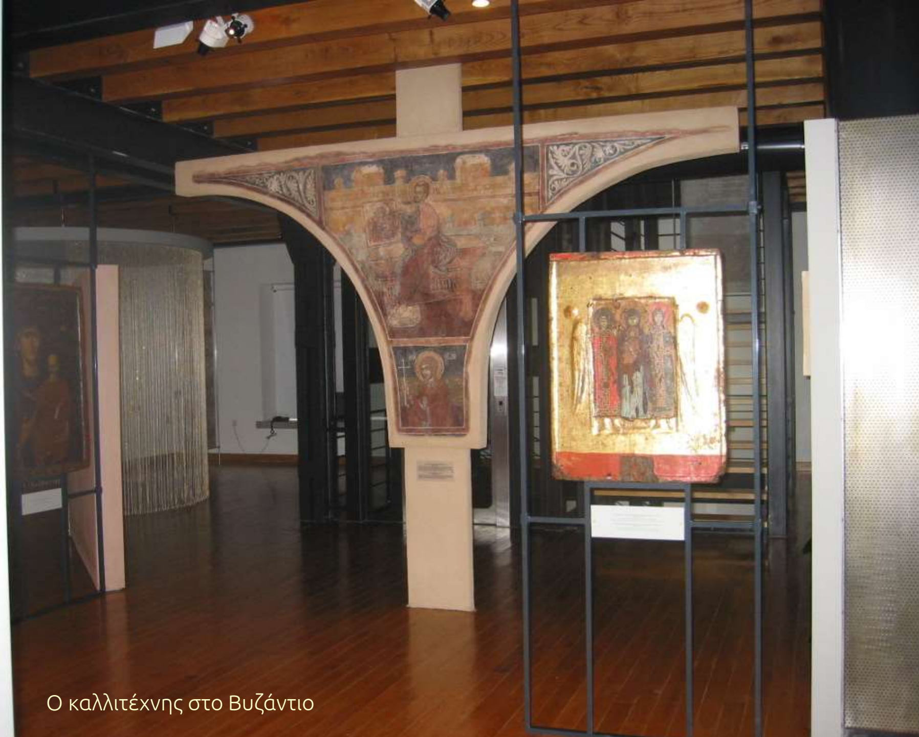
Ο καλλιτέχνης στο Βυζάντιο