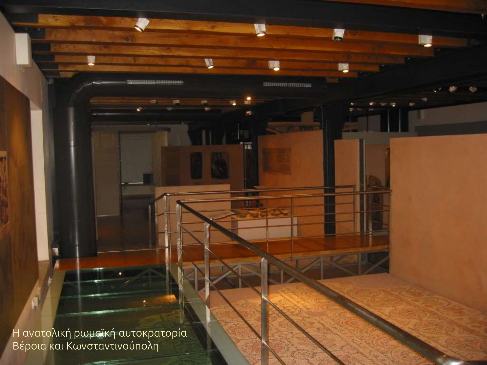
Η ανατολική ρωμαϊκή αυτοκρατορία Βέροια και Κωνσταντινούπολη