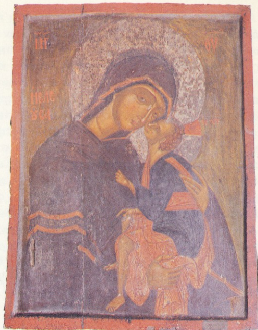
Παναγία Ελεούσα. Γύρω στο 1400.