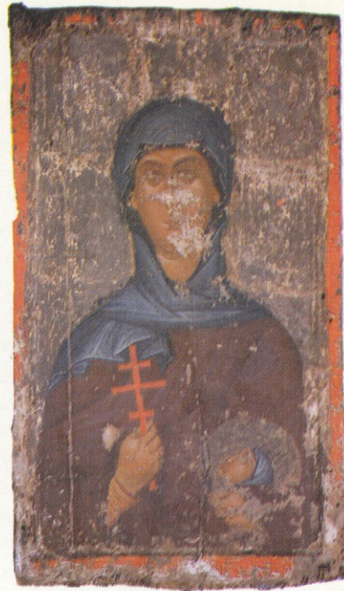
Αγία Παρασκευή. 15ος αι.

Αγ. Νικολάου (αρ. 2), στην οποία αναγνωρίζεται επιβίωση τρόπων της υστεροκομνήνειας ζωγραφικής στον 13ο αιώνα.