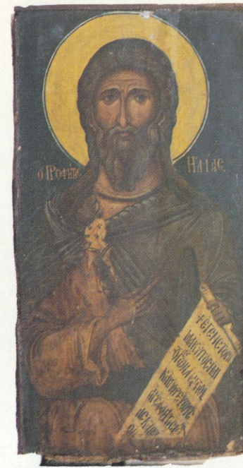
Προφήτης Ηλίας. 1180-1200.

Από τις εικόνες της περιόδου αυτής ιδιαίτερο ενδιαφέρον παρουσιάζει η εικόνα του Προφήτου Ηλίου (αρ. 1), που αποτελεί αντιπροσωπευτικό έργο της υστεροκομνήνειας περιόδου, και η εικόνα του